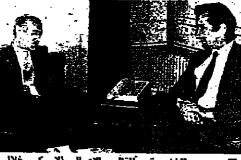
الوزير بطرس بطرس غالي

شرح الوزير بطرس بطرس غالي بالتفصيل، وكررت مصادر الخارجية أن الوزير بطرس يابل جواباً أميركياً جيد ونهائي قبل سفره إلى نيويورك في نهاية الأسبوع المقبل.